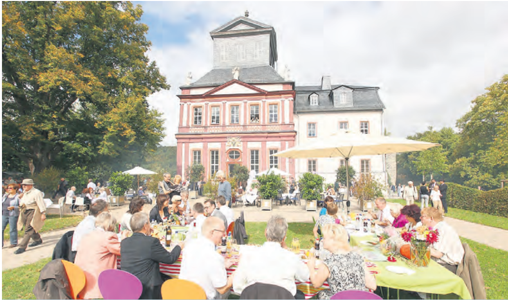
Kaiserwetter am Kaisersaal zur landesweiten Auftaktveranstaltung zum Tag des Offenen Denkmals am 10. September auf Schloss Schwarzburg. Nach dem Festakt im Zeughaus hatten die etwa 450 Gäste Gelegenheit, das Gelände und den Kaisersaal zu erkunden. Vier Thementouren führten zu kulturellen Glimpflichern im Landkreis. Mehr unter www.kreis-slf.de > Denkmaltag