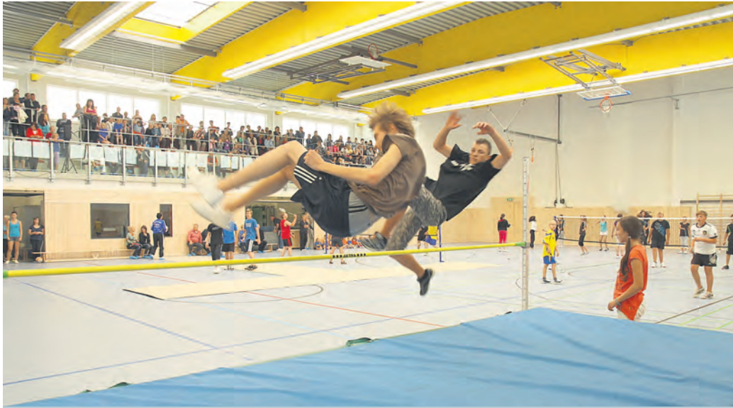
Mit Begeisterung nahmen die Schüler der Grund- und Regelschule Kaulsdorf am 23. September ihre neue Sporthalle in Besitz.