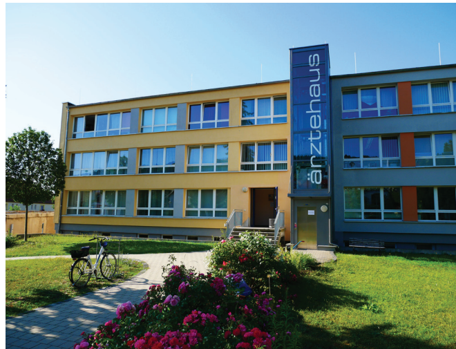
Sitz des Sozialpsychiatrischen Dienstes im Ärztehaus: Keilhauer Straße 27 in Rudolstadt.

Tel: 03672 – 823 974 Fax: 03672 – 823 973 E-Mail: spdi@kreis-slf.de